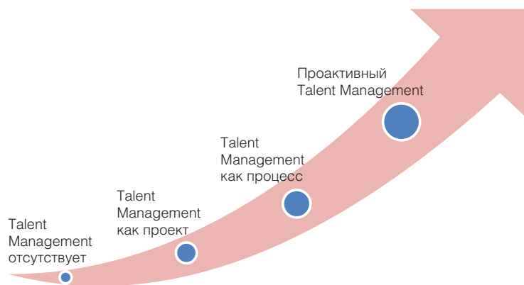
Рисунок 1. Этапы развития Talent Management в организации